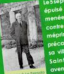
Portrait of Jules Isaac

En 1962, paraît L'Enseignement du mépris.