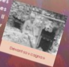
Portrait of Jules Isaac

du ministère des Affaires étrangères le 1 er février 1918. Il s'agit de constituer un fonds d'archives historiques, qui servira de fait l'accumulation d'articles de presse, après décapage.