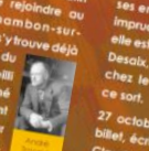
Portrait of Jules Isaac