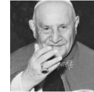
Jean XXIII 1881-1963